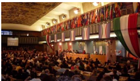
Un momento della Conferenza di Roma nella sede della FAO

sociale italiano. Le loro richieste mirano prevalentemente a una maggiore collaborazione con i Comites. Dopo una fase preparatoria di quasi due anni, i 26 giovani della Commissione hanno partecipato alla Conferenza