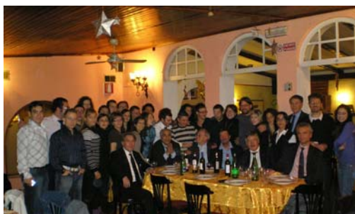
I giovani italiani a Roma con i rappresentanti del CGIE e parlamentari

creare un “dipartimento giovani all'estero” nel quadro dell'ANG (Agenzia Nazionale Giovani) e di poter partecipare con rappresentanti al Consiglio nazionale dei giovani. La nostra Commissione