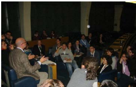
Il gruppo di Lingua e Cultura Italiana

Lingua e cultura: Tema che ruota prevalentemente intorno ai tagli previsti dalla legge finanziaria. Ciò nonostante, si è cercato di essere costruttivi, in particolare è stata segnalata la volontà di valorizzare il ruolo degli insegnanti assunti in loco, sia perché essi hanno una maggiore conoscenza del territorio, sia perché così facendo ci sarebbe un reale risparmio per lo