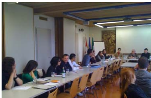
L'incontro dei giovani a Berna (gennaio 2009)

Per la Commissione CGIE dei Giovani italiani la Conferenza mondiale non è