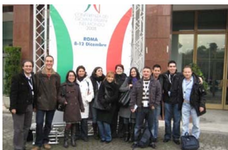
Alcuni membri della Commissione Giovani

La Commissione CGIE dei Giovani Italiani di Svizzera, Croazia e San Marino è nata nel 2007 con l'intento di avvicinare i ragazzi alla realtà del Comites e di promuovere la costituzione di una rete di